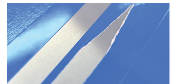
Links: tesa® Precision Mask Rechts: Standard-Abdeckband für allgemeine Zwecke