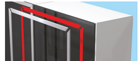
Montaje de piezas decorativas