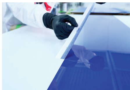
Bords de peinture excellents