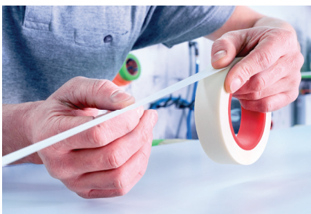
Facile à utiliser et résistant aux déchirures

Notre nouveau ruban adhésif de masquage sans silicone tesa® 4831 est conçu pour des applications très exigeantes telles que le masquage avant collage, la fabrication de composites et la construction de panneau sandwich métallique. Grâce à son support PET/non-tissé robuste, il peut être exposé à des pressions élevées et à des températures allant jusqu'à 180 °C/1h. Il ne contient pas de silicone afin d'empêcher toute contamination des surfaces avec de la masse adhésive silicone. Ainsi, les étapes du processus ultérieur peuvent être réalisées avec une fiabilité maximale sans qu'un nettoyage fastidieux soit nécessaire.