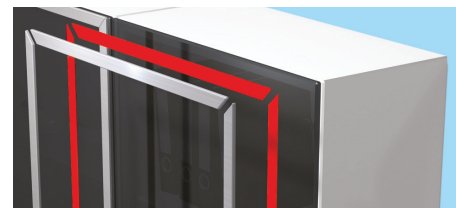
Fissaggio di parti decorative