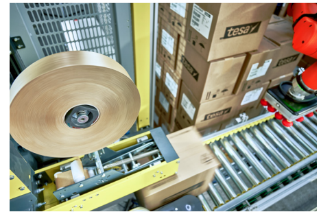
Perfekt lösning för tuffa förpackningsapplikationer (upp till 20 kg)