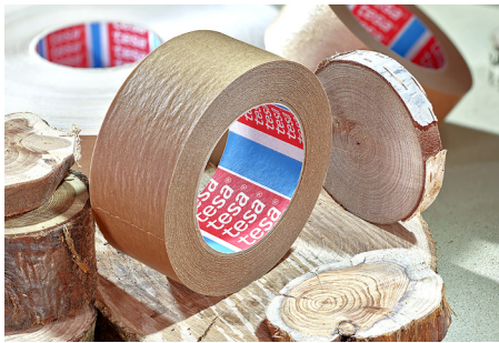
Papper från ansvarsfullt förvaltade certifierade skogar och andra kontrollerade källor

Kombinationen av den certifierade pappersbäraren och det lösningsmedelsfria häftämnet av naturgummi gör denna produkt till den perfekta lösningen för förpackningsapplikationer på upp till 20 kg. tesa® 60408 kan användas till manuella och automatiska applikationer och kan tryckas på med alla typer av bläck.